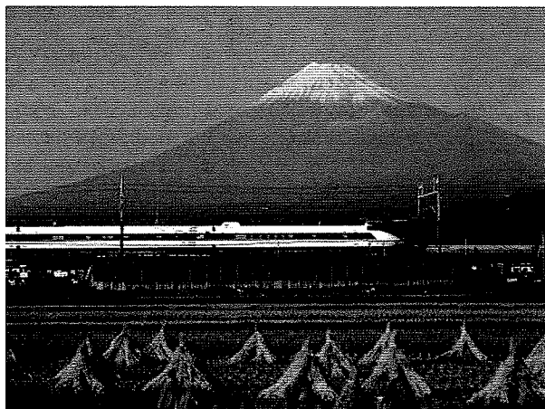
1. ábra Shinkansen gyorsvasúti híd Japánban

Az optimalás a jobb megoldások keresése, amelyek jobban megfelelnek a követelményeknek. A teherviselő mérnöki szerkezetek fő követelményei: a terhelhetőség, a biztonság, a gyárthatóság és a gazdaságosság.