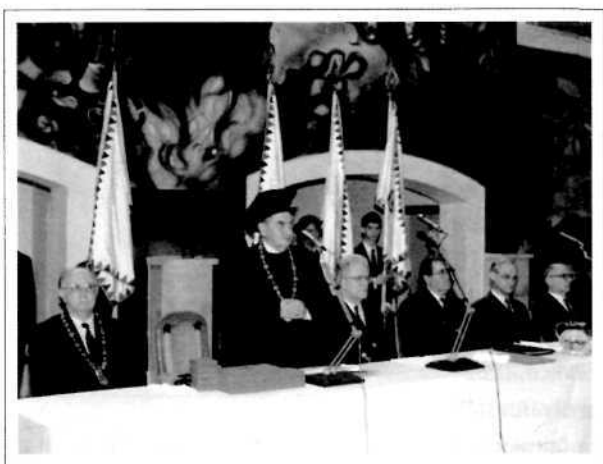
Jogi doktorok avatása az 1990-es években

Az első tanév végén történt meg az első kísérlet az ELTE 1980-ban elfogadott és Miskolcra kölcsönzött tantervétől való eltávolodásra, a helyi elképzelések és a vidéki jogi karok gyakorlatának részbeni érvényesítésére. Ennek keretében az 1982. május 27-i Egyetemi Tanács döntött a jogtörténeti komplex gyakorlat átlagba számító jeggyel történő lezárásáról, a Szervezélmélet, a Családi jog tantárgyak gyakorlattal történő bővítéséről, a filozófiai és polgári jogi gyakorlatok óraszámának bővítéséről. A Bevezetés a jogszabálytanba című tantárgy helyett – Bihari Mihály gyors távozása után – a Bevezetés a jogösszehasonlításba elnevezésű, tematikájában megújult diszciplína került. A latin nyelv visszaszorítására irányuló törekvésekkel