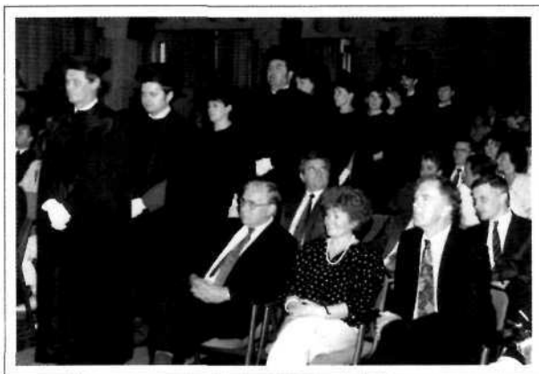
Jogi doktorok avatása az 1990-es években

Az 1984 február 1-i kari tanács megalakította azokat a kari testületeket, bizottságokat, amelyek a kari élet egy-egy részterületén javaslattevő, vagy ügydöntő hatáskört gyakoroltak. Ide tar-