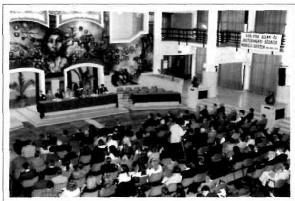
Az OTDK-ra érkező Dávid Ibolya igazságügyminiszter