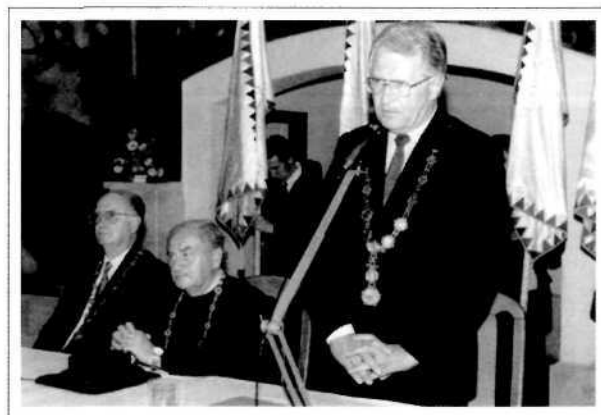
Jogi doktorok avatása az 1990-es években

A miskolci jogi képzés kedvezően hatott a jogi oktatás egészére: a nappali tagozat aránya országosan 38,5%-ról 58,8%-ra emelkedett. Ezen belül a budapesti kar részvételi aránya 52,3%-ról 36%-ra csökkent, tehát a vidék szempontjából kívánatos átalakulás is megtörtént. Teljesült a regionális szintű elvárás is, a nappali hallgatók 80%-a tartósan a vonzáskörbe tartozó megyékből jelentkezett.