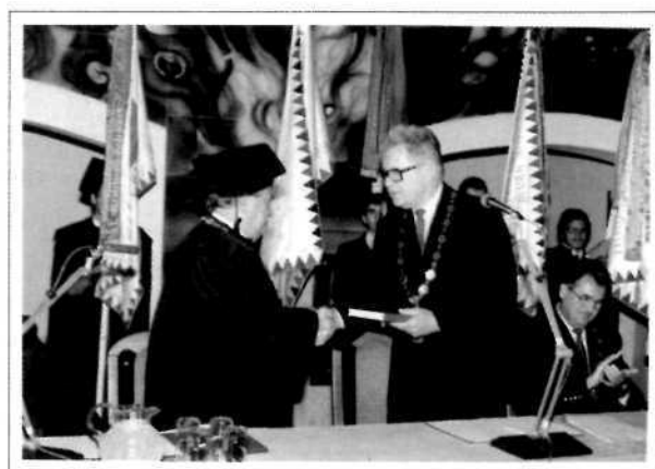
A 15-éves ünnepi rendezvény elnöksége (1996)