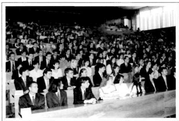
Tanévnyitó, hallgatóvá fogadás (1997)