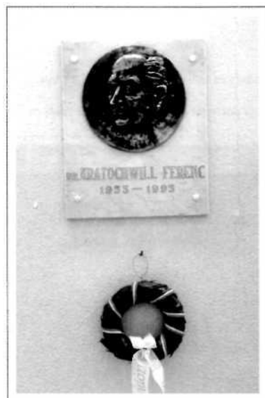
Kratochwill-emléktábla és -tancsereg avatás a 15 éves ünnepség keretében (1996)