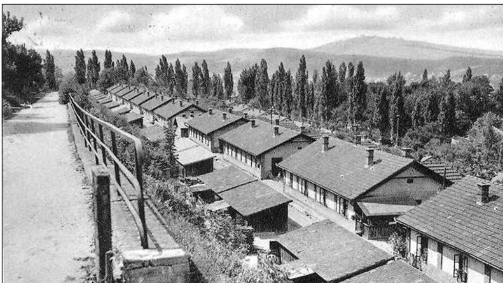
Ózd, „Kisamerika” nevű munkástelep

Fontos értékmérője volt a lakásnak az, hogy milyen távolságra volt a gyártól, az üzemtől. A XIX. század végi, XX. század eleji telepeknél minél közelebb helyezkedett el, annál rangosabb volt. Több kolónia esetében – például Diósgyőr-Vasgyárnál – az igazgató sokszobás, reprezentatív háza közvetlenül a bejáratnál található. A későbbiekben, pár évtizeddel ezelőtt ez a folyamat megfordult, napjainkban az az érték, ha a lakóhely jelentősen távolabb helyezkedik el a munkavégzés helyétől. Ez a térfelfogás a kolóniák temetőiében is fellelhető, vannak szakmunkás sorok, tiszt, tisztviselői részek, külön helyezkednek el az egyes munkakörökben dolgozók nyughelyei.